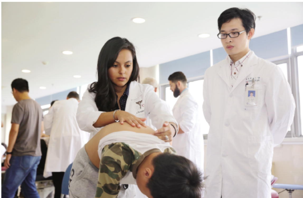
9月28日,Aspine Health Group(“脊医无国界”非营利慈善机构)在我院举办大型义诊,来自美国的8位脊椎神经专家为130余名患者开展免费康复治疗。义诊让市民足不出“嘉”就享受国际水平的专业诊治,也提高了对脊椎健康的认知及保健意识。(文:章鸣泽)